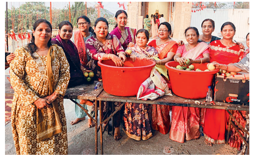
डोंगरगढ़। नवरात्र पंचमी को फलों से माता रानी का सिंगर किया गया था। इन फलों को आज समाज की महिलाओं ने प्रसाद के रूप में वितरित किया।