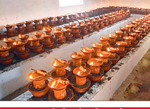
आज महाष्टमी, विसर्जन रविवार को