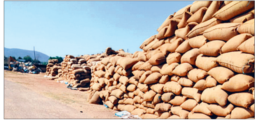
समितियों में धान के जाम रहने से यह तो तय है कि प्रशासन अपने दायित्वों का निर्वहन करने में फेल रहा है। एक पखवाड़े क्विंटल से धान खरीदी शुरू होने के बाद अब तक पूरे धान का परिवहन नहीं हो पाया है।

मोहारा सहकारी बैंक अंतर्गत आने वाली सोसायटियों में धान परिवहन की समस्या अभी तक बनी हुई है। करीब तीन माह पहल धान बंद हुई थी किन्तु अब तक धान का परिवहन नहीं हो पाया है। जानकारी के अनुसार खुसीपार, मोहारा, विचारपुर और छिपा सोसायटी में कहीं 5 हजार तो कहीं 10 हजार क्विंटल धान जाम है। धान जाम होने से सोसायटी प्रबंधक परेशान है। कुछ प्रबंधकों ने बताया कि धान का अब डीओ नहीं काटा गया है जिससे उनकी चिंता बढ़ गई है।