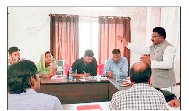
वसूली टेका नीलामी वित्तीय वर्ष 2025-26 हेतु प्राप्त उच्चतम बोली राशि 4,90 लाख की स्वीकृति, मुख्यमंत्री नवीन पेंशन योजनांतर्गत प्राप्त आवेदन पत्रों की स्वीकृति, राष्ट्रीय परिवार सहायता योजनांतर्गत प्राप्त आवेदन पत्रों की स्वीकृति, ग्रीष्म काल में निजी एवं सार्वजनिक नल कनेक्शन पर प्रतिबंध करने का प्रस्ताव शामिल था। इन विषयों पर अध्यक्ष पार्षदों एवं अधिकारी और कर्मचारियों से रायशुमारी के बाद बजट में शामिल किया गया। इस दौरान तय किया गया कि जल संकट को देखते हुए नए निजी एवं सार्वजनिक नल स्वीकृत न किया जाए। अति आवश्यक होने पर स्थल निरीक्षण कर ही निजी या सार्वजनिक नल दिया जाए।